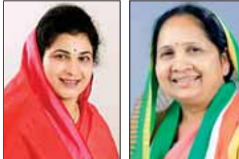
मामले की जानकारी नहीं है। इस मामले में विधायक से चर्चा कर आगे की कार्रवाई करेंगे।